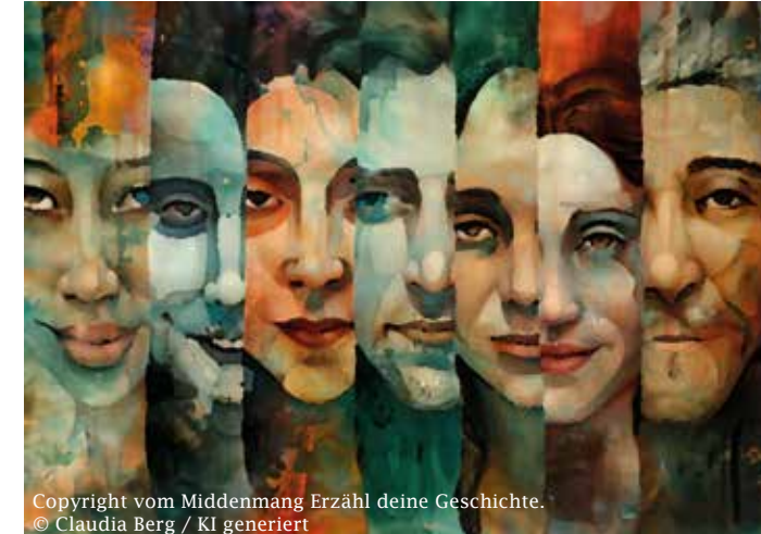
Copyright vom Middenmang Erzähl deine Geschichte. © Claudia Berg / KI generiert

ERZÄHL DEINE GESCHICHTE • • • ONLINE-MAGAZIN MITTENMANG Ihr habt etwas zu erzählen?! Egal ob jung oder alt, ob selbst geschrieben oder selbst gemalt, ob mit Fotos oder mit Videos – alle Formate und Themen sind willkommen. Hier könnt ihr loswerden, was euch bewegt: www.mittenmang-magazin.de/deine-Geschichte